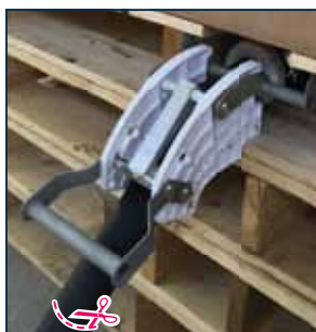
5. Sluit de kraan en, wanneer nodig, knip de slang af