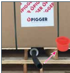
1. Trek de rubberen slang uit de pallet en verwijder de rode dop