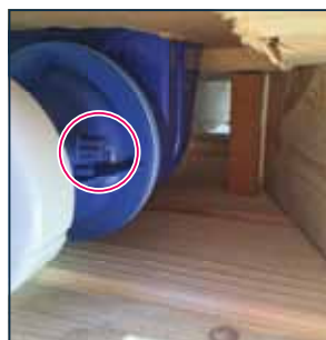
6. De big box sluiting vindt u onder de pallet