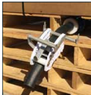
2. Trek de rubberen slang door de kraan