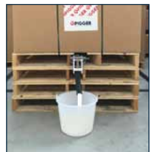
8. Open de kraan om de melk uit te gieten