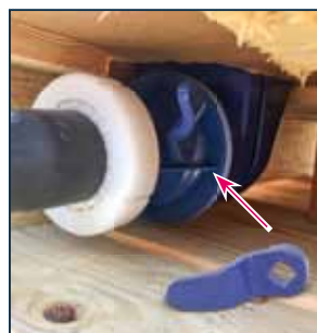
7. Plaats de blauwe sleutel op de sluiting en draai deze naar beneden om de sluiting te openen