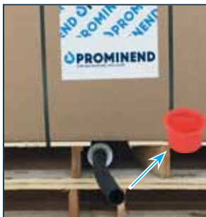
1. Trek de rubberen slang uit de pallet en verwijder de rode dop