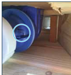
6. De big box sluiting vindt u onder de pallet