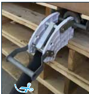
5. Sluit de kraan en, wanneer nodig, knip de slang af