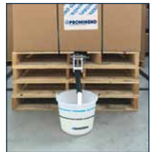
8. Open de kraan om de melk uit te gieten